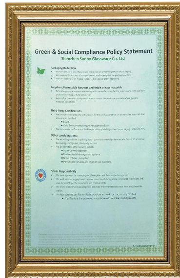
Green at responsibility sa lipunan Pahayag ni Polidy