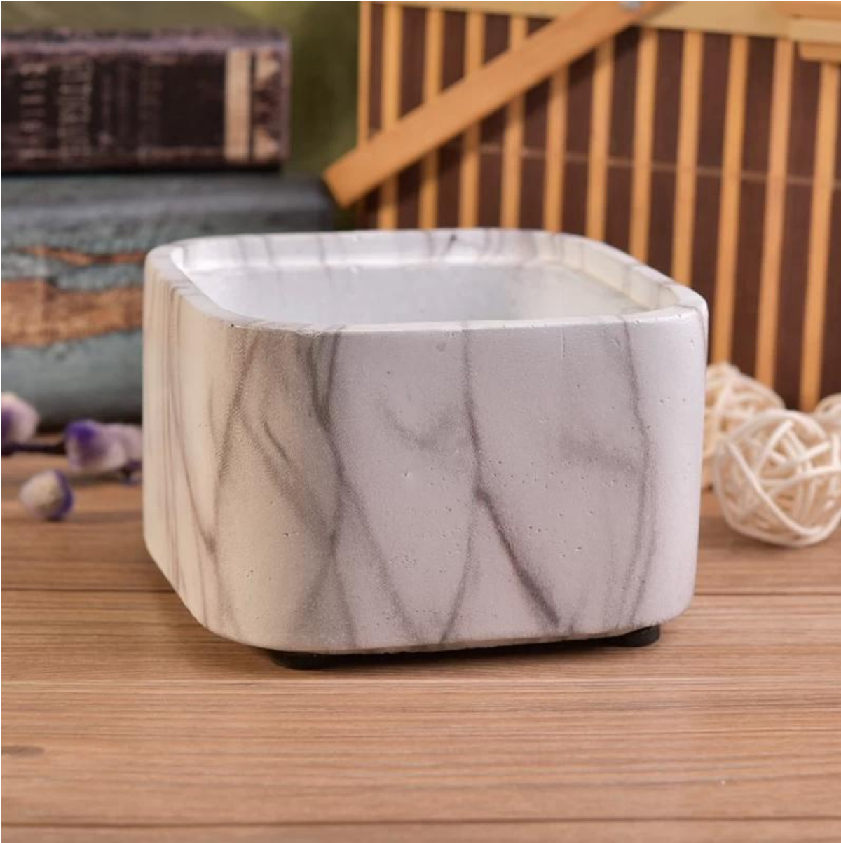
Mga katugmang accessories: