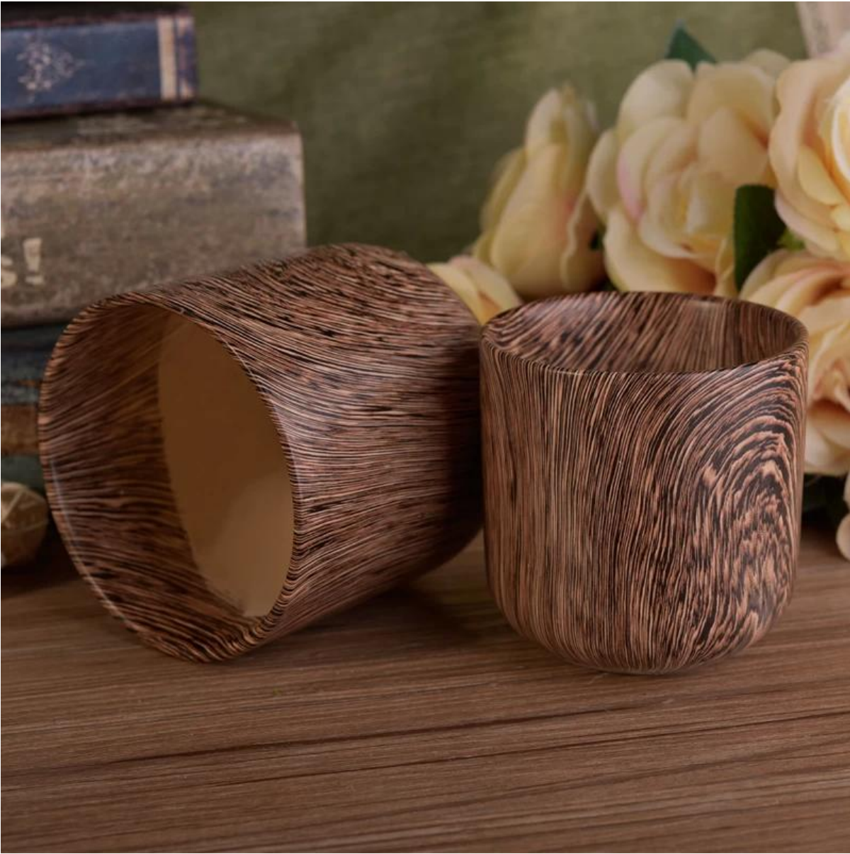
Mga katugmang accessories: