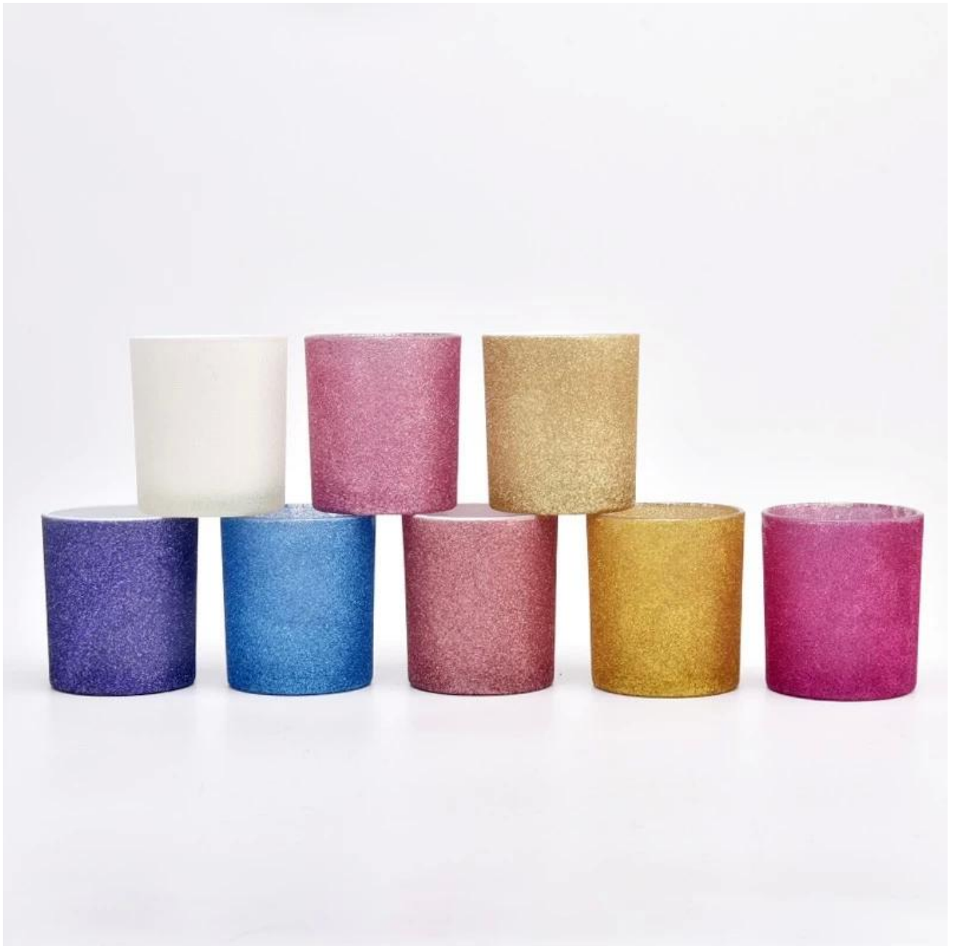
Mga kagamitan sa kandila