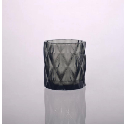
mga may hawak na kandila na salamin na brilyante na kulay