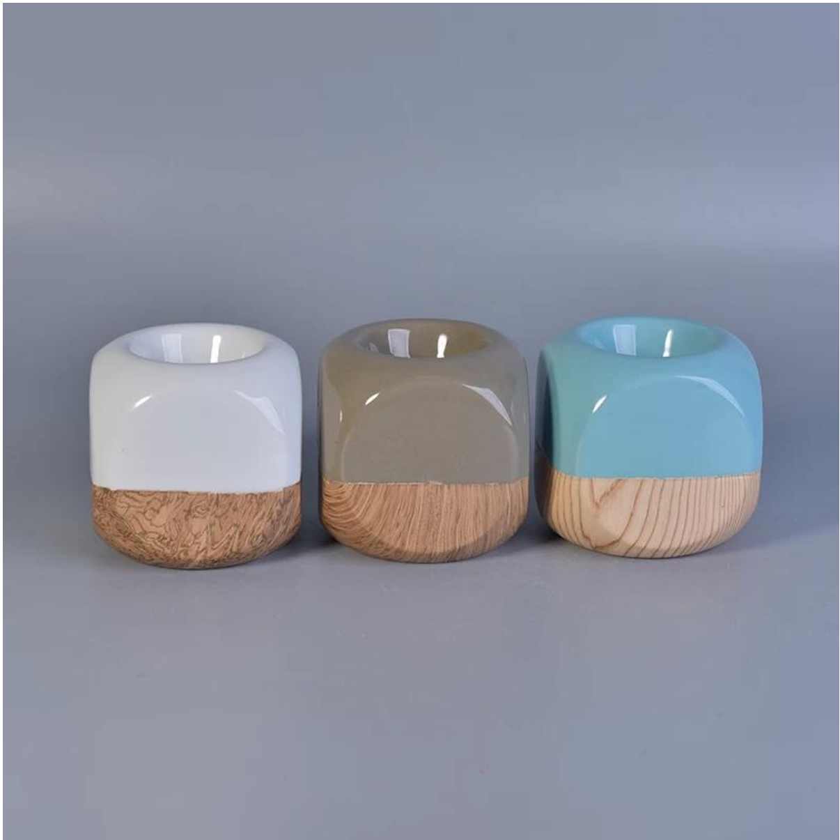
Mga katugmang accessories: