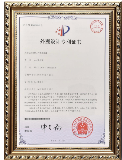
Nr patentowy: 201630655323.4