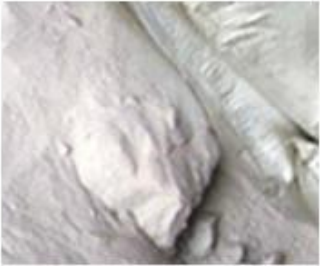
1、 Raw Material