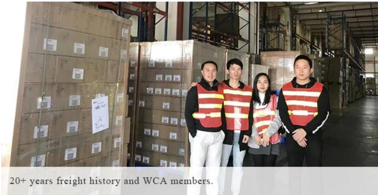
20+ years freight history and WCA members.