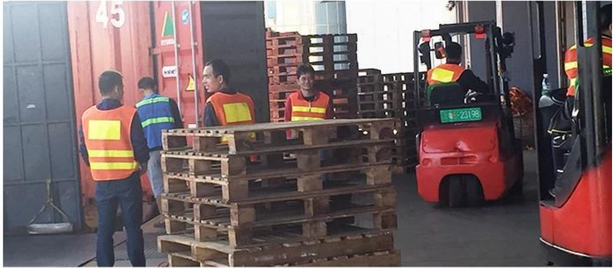
Own professional shipping company( Shenzhen Sunny Worldwide logistics)