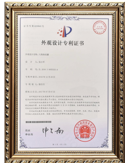
Nr patentu: 201630655323.4