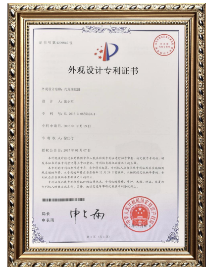
Nr patentu: 20163065323.4