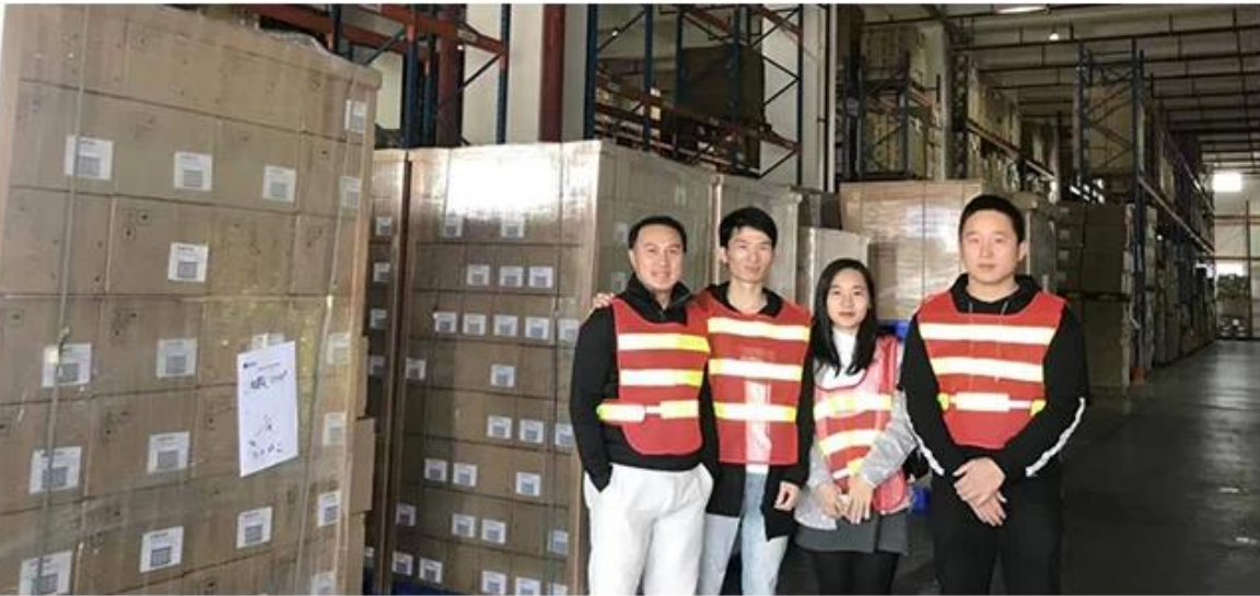
20+ years freight history and WCA members.