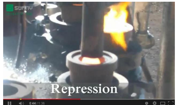
Technologia prasy maszynowej