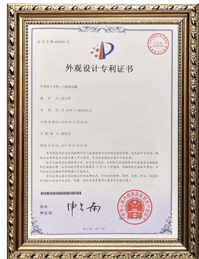
Patent nr: 201630655323.4