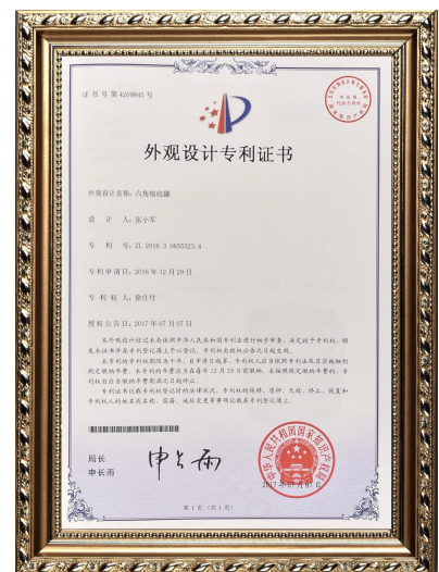
Nr patentu: 201630655323.4