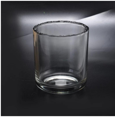
unikalne uchwyty na koronkę do dekoracji domu