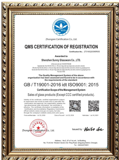
ISO 9001: 2015