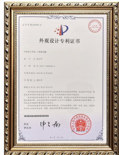
Patent nr: 201630655323.4