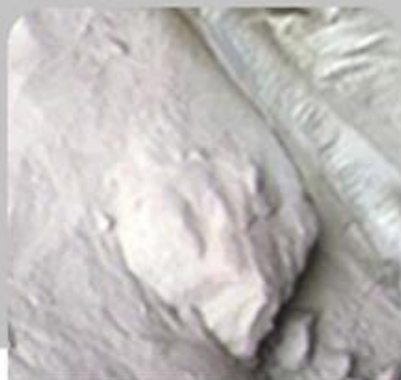
1、 Raw Material