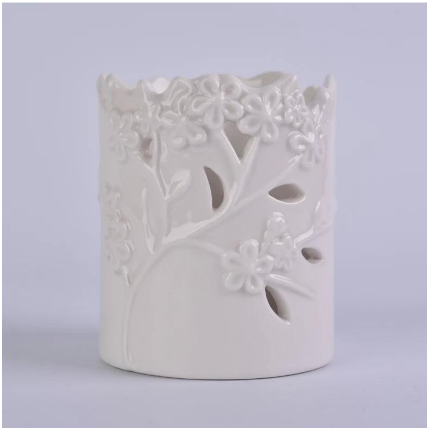
Outro suporte de vela de cerâmica