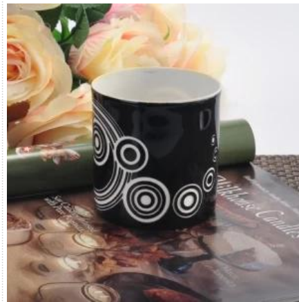
Frasco de cerâmica cilíndrico de alta qualidade para velas