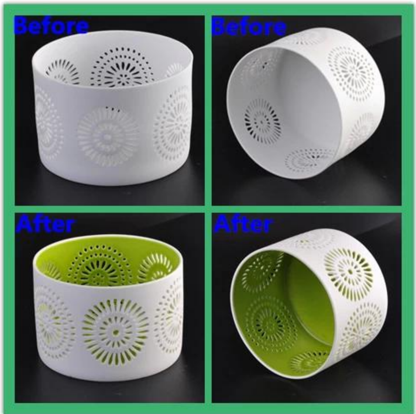
Mais velas de cerâmica de mármore branco Titulares