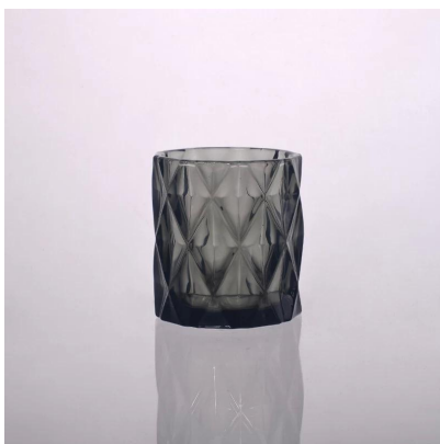
castiçais de vidro de diamante de cor sólida