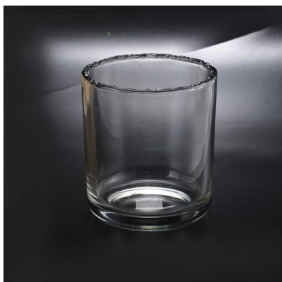
porta-rendas com decoração exclusiva para a casa