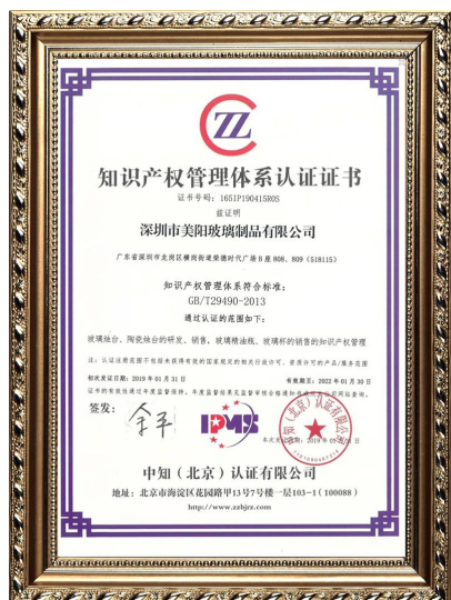
Enterprise Intellectual Property Patent No.:201630655323.4