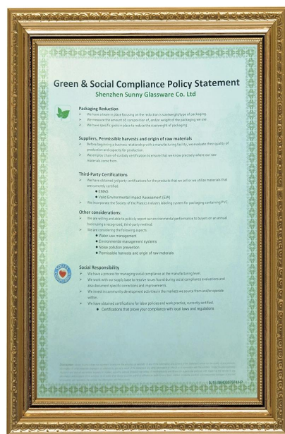
Conformitate ecologică și socială Declarația Polidy