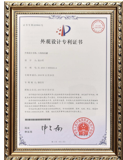
Brevet nr.: 201630655323.4