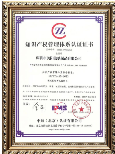
Proprietatea intelectuală a întreprinderii