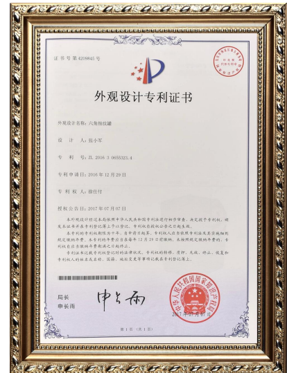
Brevet nr.: 201630655323.4