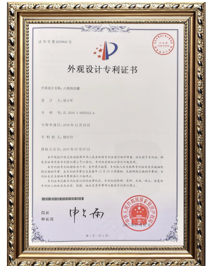
Brevet nr.: 201630655323.4