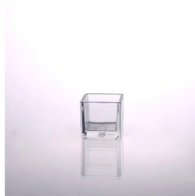
decor pentru casă suport de lumânare pătrat din sticlă