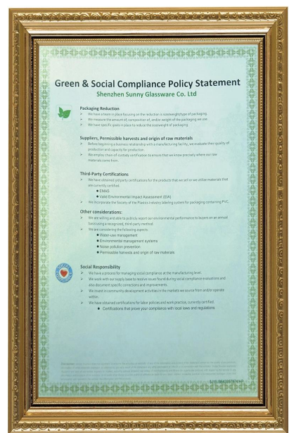
Экологическое и социальное соответствие Заявление Polidy