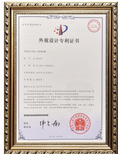
Патент No.: 201630655323.4.