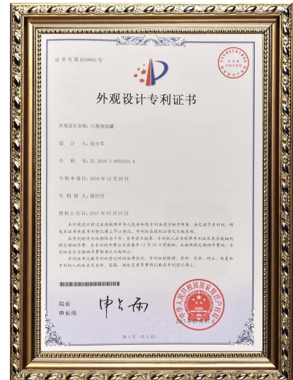
Патент No.: 201630655323.4.