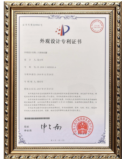
Номер патента: 201630655323.4.