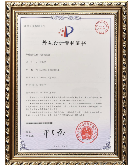
Номер патента: 201630655323.4.