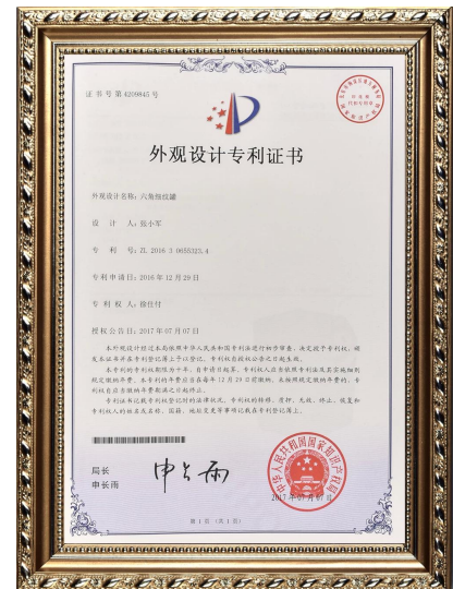
Номер патента: 201630655323.4.