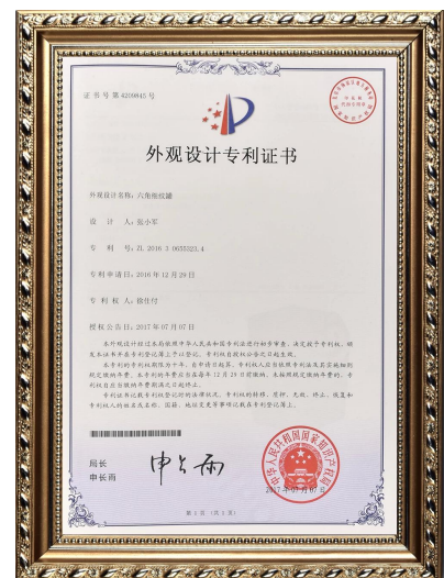
Patent č.: 201630655323.4