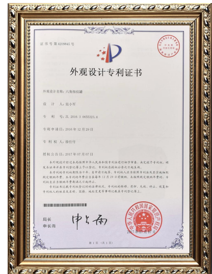
Patent č.: 201630655323.4