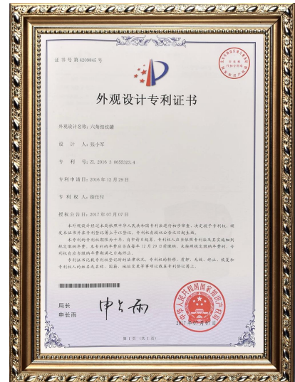
Patent nr: 201630655323.4