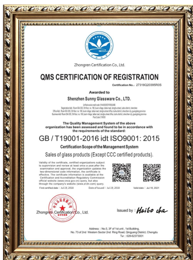
ISO 9001: 2015