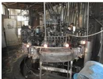
□ Machine Blown