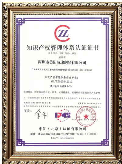
Företagets immateriella rättigheter