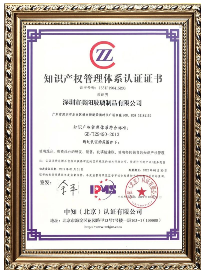
Företagets immateriella rättigheter