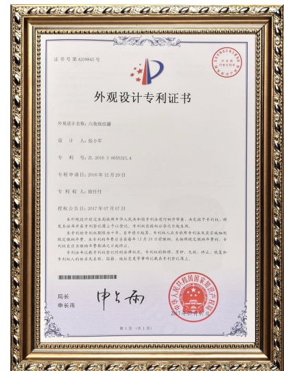
Patent nr: 201630655323.4