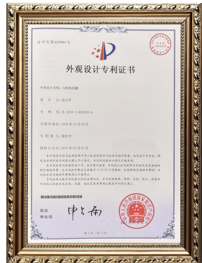
Patent nr: 201630655323.4