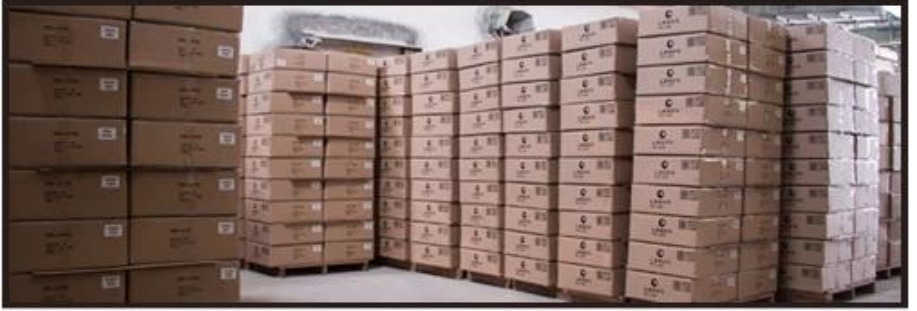
Ready to loading