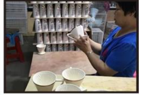
Inspection the decal product