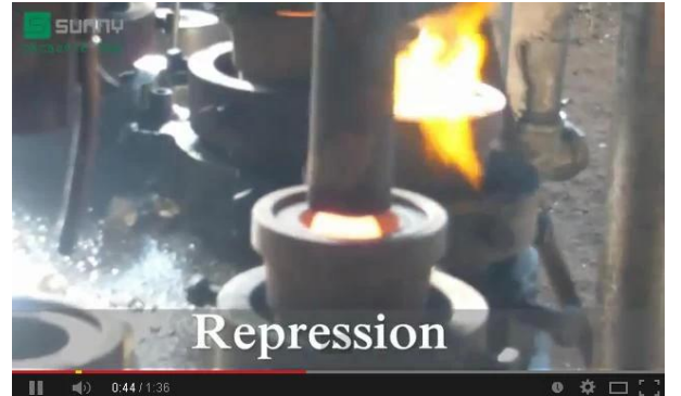
Makine Pres Teknolojisi