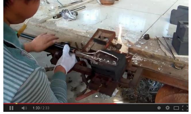
El Üflemleri Teknoloji