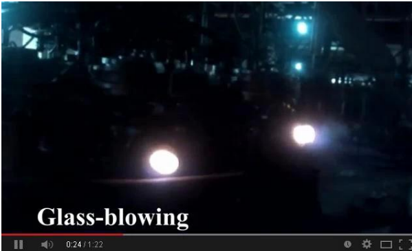
Makine Üfleme Teknoloji

Bu vesile ile üretim hatları videomuzu çevrimiçi olarak izleyin ve bizi yerinde ziyaret etmenizi bekliyoruz.