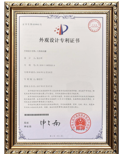
Patent No: 201630655323.4