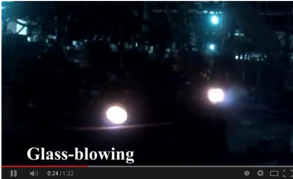
Makine üfleme teknolojisi

Bu vesile ile üretim hattı videomuzu çevrimiçi olarak izleyin, sitemizde bizi ziyaret etmenizi bekliyoruz.