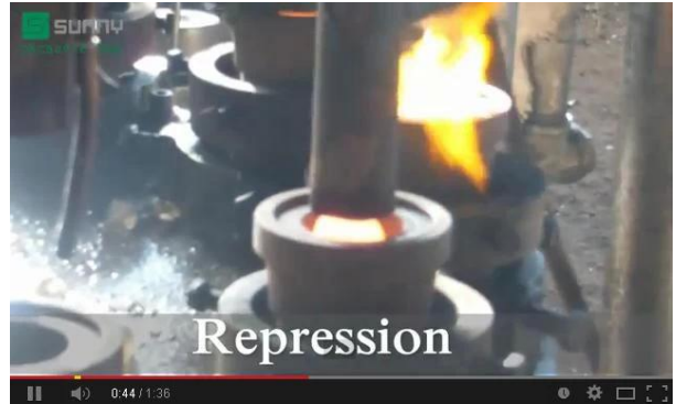
Mekanik pres teknolojisi