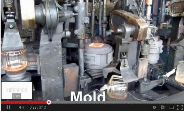
IS makine teknolojisi