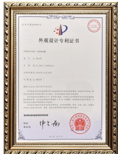
Но патенту :201630655323.4