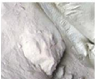
1、 Raw Material