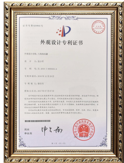
Патент №: 201630655323.4