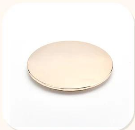
Zinc Alloy Cover