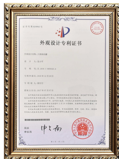
Номер патенту: 201630655323.4