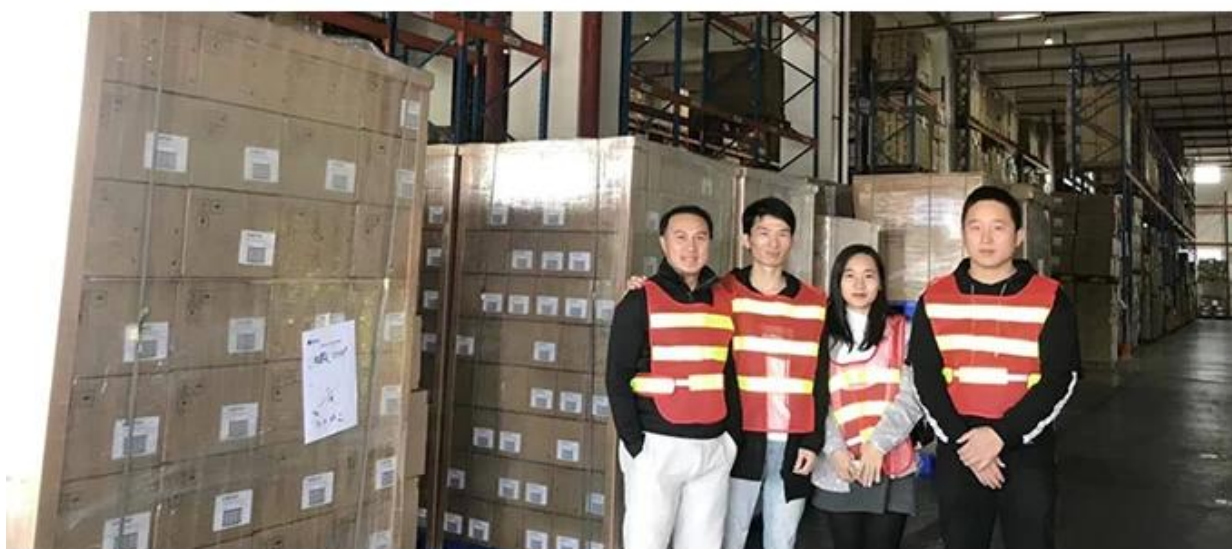
20+ years freight history and WCA members.