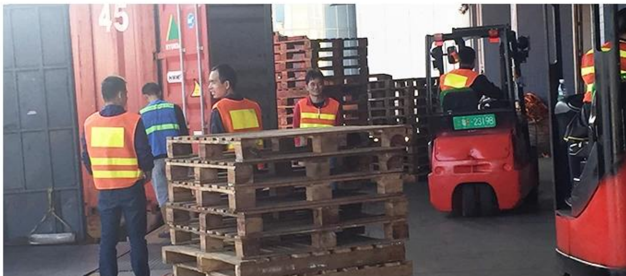
Own professional shipping company( Shenzhen Sunny Worldwide logistics)